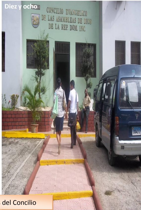
Llegando a las Oficinas del Concilio