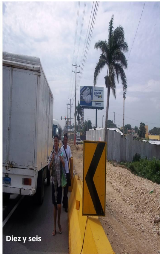
Diez y seis