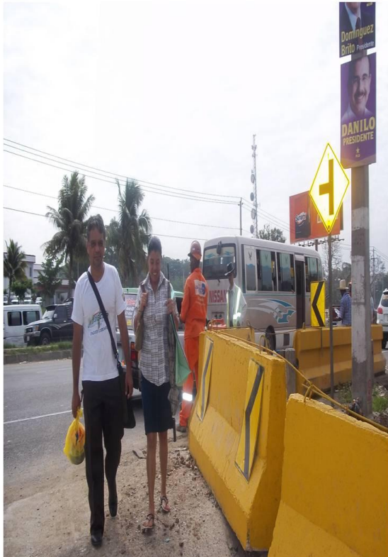
Diez y siete